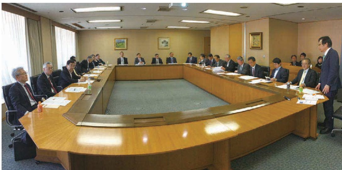
▲RC委員会: 担当役付役員、生産技術部長、人事部長、購買部長、全事業部長、全工場長、全研究所長。年1回開催。 (委員長: 環境安全・品質保証部長)